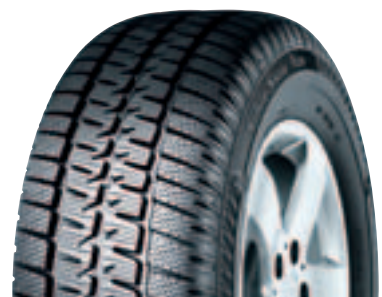
SIBIR SNOW VAN MPS 530 ❄️